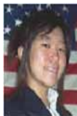
R 2 : Supporter

今月号をもって、R 2 編集部のメンバーが変わります。そこで最後に、現在の編集部のメンバーが皆さんにメッセージを送ります。R 2 編集部は Director, Editor, Supporter(2名) というメンバー構成で成り立っています。4人が最後にそれぞれの思いをつづりました。