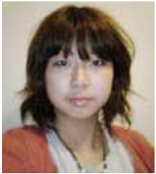
R 2 : Director