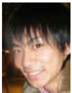
R 2 : Editor

3月となり、日本では様々な転機の訪れとなります。それは進学、進級、就職など形となって訪れるものもあれば、春の訪れとともに心境の変化も訪れることでしょう。この一年間、私はR 2 の編集者として、学生の皆様に渡されるR 2 を形ある物にしてきました。学生たちへ、しっかりと印象に残るようにという思いを込めてR 2 通信やレイアウト構成などを勤めてきました。情報誌R 2 というのは形のあるものですが、私たちR 2 が求めることは形のない物です。それは学生皆の心境の変化です。先輩方のメッセージを読んでもらうことで学生たちに留学に対する心境の変化が生まれると期待しています。