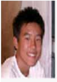
R 2 : Supporter

今から4年前、僕がまだ派遣候補生だった頃にR 2 は創刊されました。つまり僕らの代はR 2 を最初に受け取った学生なのです。あの頃は毎回オリエンテーションで次のR 2 をもらうのが楽しみで仕方ありませんでした。